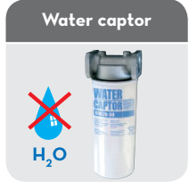
Code: R12738000 (Key lock not included)