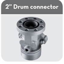
with integrated valve Code F17163000