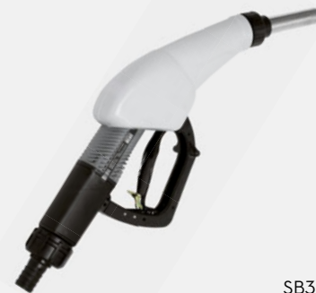
SB325 AUTOMATIC NOZZLE