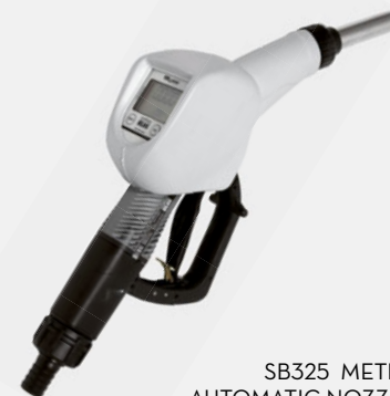
SB325 METER AUTOMATIC NOZZLE