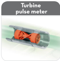
Turbine pulse meter