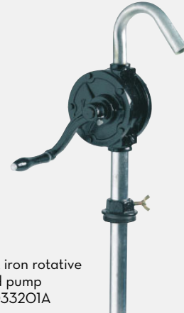
Cast iron rotative hand pump F0033201A