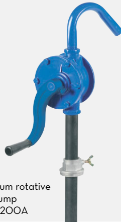
Aluminium rotative hand pump F0033200A